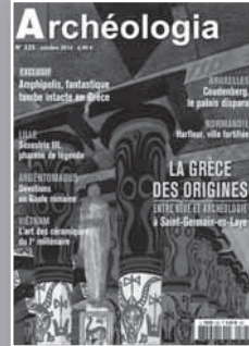
ARCHÉOLOGIA L'archéologie en France et dans le monde