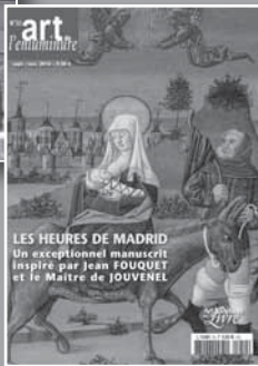
ART DE L'ENLUMINURE Les chefs-d'œuvre de l'enluminure

éditions FATON art, archéologie, histoire, lettres et sciences. www.faton.fr