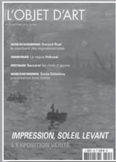
L'OBJET D'ART Les découvertes de l'histoire de l'art