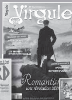
VIRGULE Le français et la littérature pour les 10-15 ans