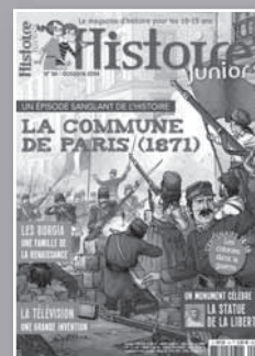
HISTOIRE JUNIOR Pour que l'histoire passionne les collégiens