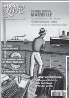
ART & MÉTIERS DU LIVRE Reliure, estampe, bibliophilie