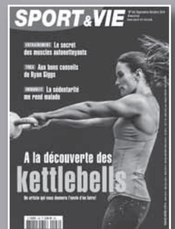
SPORT & VIE Physiologie de l'effort