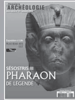
DOSSIERS D'ARCHÉOLOGIE Synthèse sur un thème majeur de l'archéologie