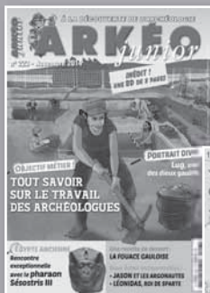
ARKÉO JUNIOR Les enfants à la découverte de l'archéologie

éditions FATON art, archéologie, histoire, lettres et sciences. www.faton.fr