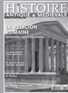
HISTOIRE ANTIQUE Les hommes et les civilisations de l'Antiquité