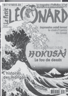
LE PETIT LÉONARD L'art expliqué aux enfants dans un magazine attrayant