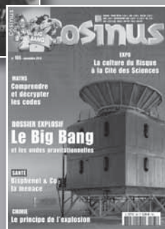
COSINUS Pour devenir curieux des maths et des sciences